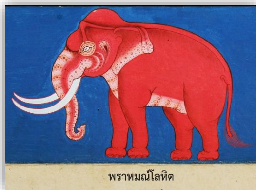
พราหมณ์โลหิต

ลักษณะเด่นคือ มีเนื้อหนังอ่อนนุ่ม หน้าใหญ่ ท้ายต่ำ ขนอ่อนละเอียด เส้นเรียบ โขมตสูง คิ้วสูง น้ำเต้าแผด มีกระเต็มตัว ขนที่หลังหูลุ่ ปาก และขอบตาสีขาว ออกใหญ่ งามมีสีเหลืองเรียวยาวงาม